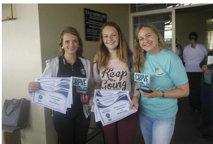
Figura 2: Entrega da premiação “A Flor da Crise”

Também foram produzidos quatro vídeos em forma de documentário, atividade proposta pela professora de história, envolvendo também os professores de línguas e informática, onde os alunos do 8º ano demonstraram grande interesse e colocaram em cena suas habilidades artísticas para expor sua cultura usando um simples celular.