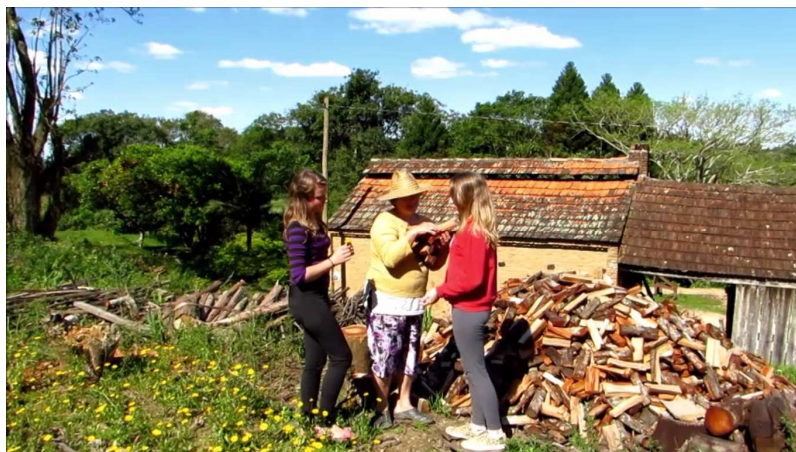
Figura 1: Cena da filmagem “A Flor da Crise” na casa dos avós da aluna

família de duas alunas foi “A Flor da Crise” 4 , vídeo descrevendo a flor Calêndula como a flor que representa a crise na cultura pomerana, com premiação de Melhor Arte, Melhor Produção e Melhor Curta de Temática Ambiental no I Congresso Brasileiro de Produção de Vídeo Estudantil. Este filme também concorreu como melhor documentário no 2º Festival de Cinema Escolar de Alvorada - RS.